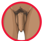
Botona bo sa bollang

Bomadimabe ba ho dula o sa bolla kapa o sa bolla ka ho phethahala ke: